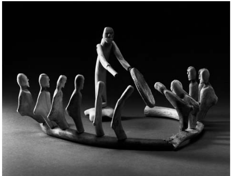
ART GALLERY OF ONTARIO

Les Inuits de Baker Lake possèdent un riche patrimoine culturel, vieux de quelques milliers d'années. Avant que leur vie n'ait été bouleversée par les influences venues du Sud, ils se répartissaient en cinq groupes distincts, solidement implantés à travers le territoire. L'avènement d'une ère nouvelle est imputable à trois grands intervenants : le gouvernement, l'Église et les écoles. Pendant les années 50, les Inuits de